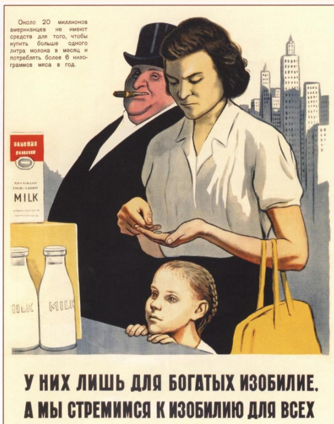
“Eles só têm abundância para os ricos”, cartaz soviético, 1957.