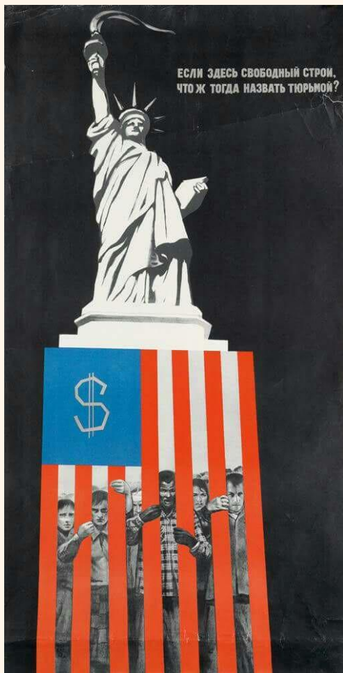
“Se isso é liberdade, o que é prisão?”, cartaz soviético, 1968.