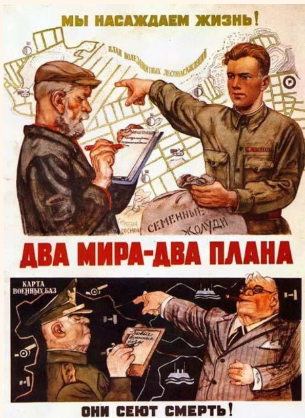
“Dois mundos – dois projetos”, cartaz soviético de 1950.