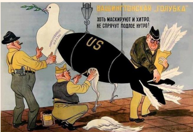
“A pomba de Washington”, título da charge de Boris Efimov, 1953.

Em contrapartida, ressaltava a superioridade do regime comunista, em que o Estado garantia emprego, educação e moradia para o cidadão. Valorizava o espírito coletivista da sociedade comunista em que a produção industrial e agrícola era distribuída de maneira equitativa à população. Destacava que a economia comunista era planejada evitando crises econômicas e oscilações financeiras tão comuns nos países capitalistas.