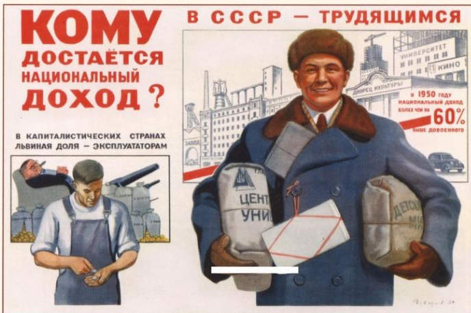
“Quem recebe a renda nacional?”, cartaz soviético de 1950.