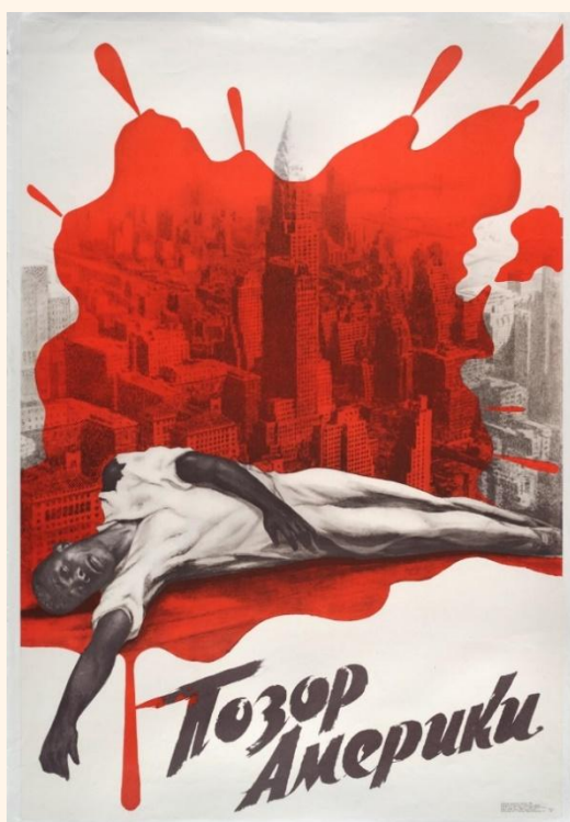
“Vergonha americana”, cartaz soviético, 1968.