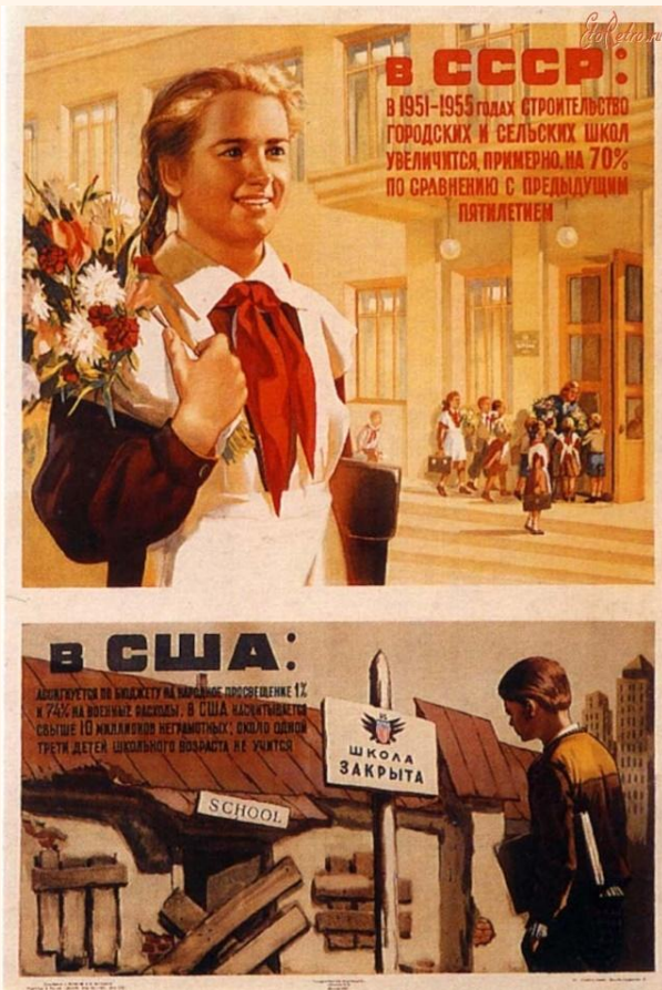
A educação soviética e a americana, segundo o cartaz soviético de 1955.